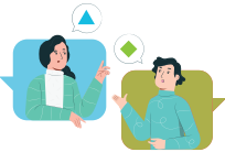
Miskomunikasi dengan Majikan